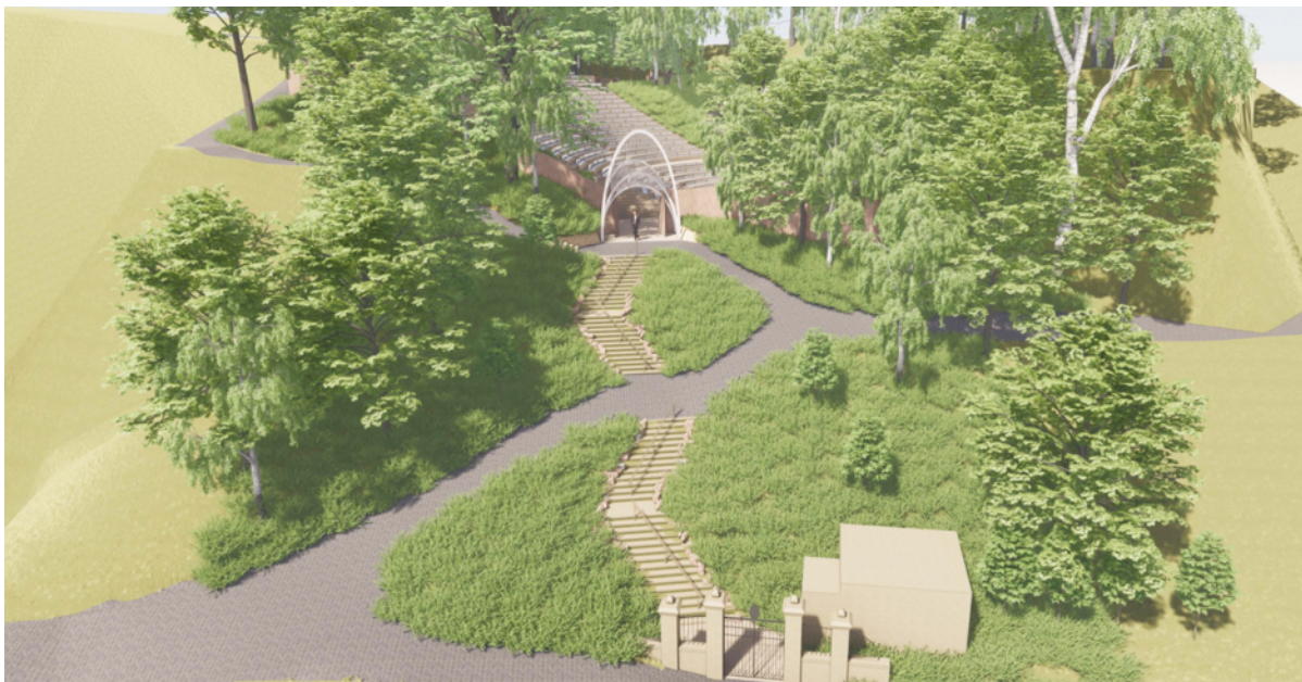
Het ontwerp voor de entree en geluidswerende wand (december 2020)

Door de groeiende aantallen bezoekers worden een aantal knelpunten steeds manifester. Als gevolg van een politieke beslissing in het begin van de eenentwintigste eeuw is het bestemmingsplan van het gebied, waarin het theater ligt, niet geheel adequaat.