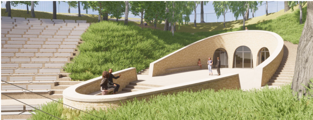
De 'ondergrondse' foyer en het nieuwe terras (december 2020)

Helaas is architect Huub Segeren in maart 2020 overleden. Zijn werk is overgenomen door Twan van Lanen van 'van Lanen Architecten' uit Eindhoven waarmee Huub Segeren al lange tijd mee samenwerkte.