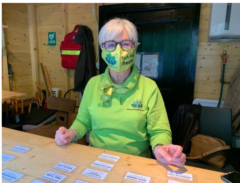
Een vrijwilliger, goed voorbereid voor de voorstelling in corona-regiem

In dit verslag worden met het woord theater steeds de beide theaters bedoeld.