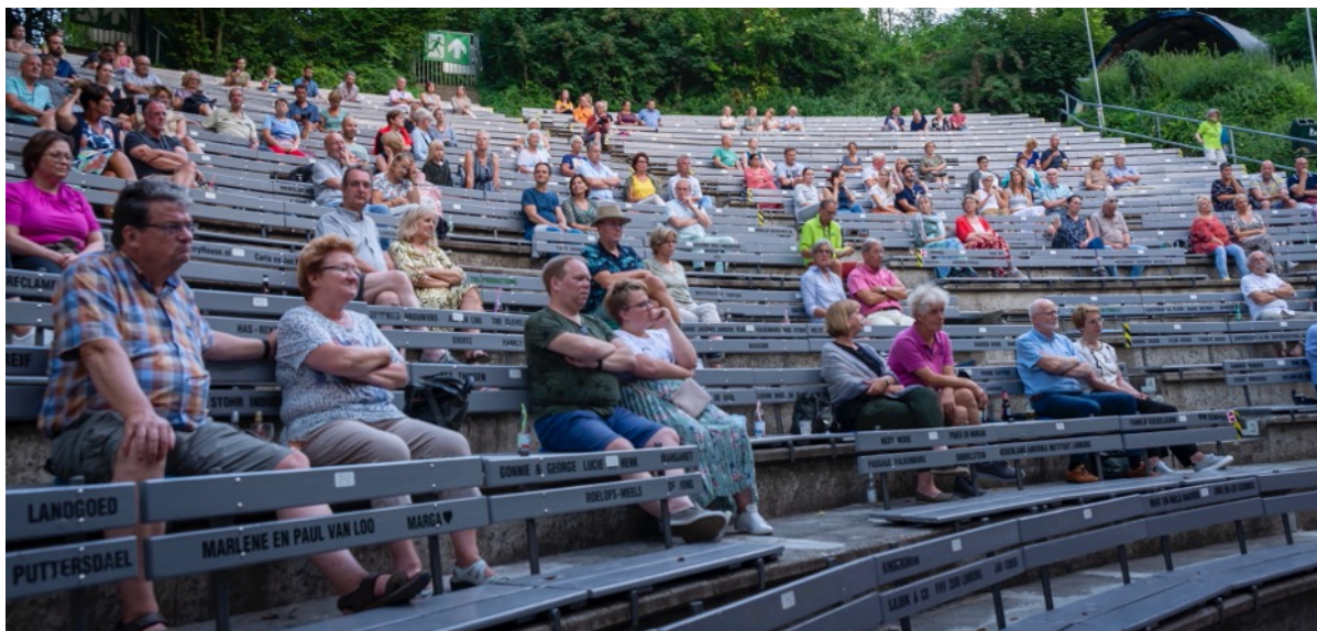
Een uitverkocht huis tijdens coronatijden

De vrijwilligers werden van tevoren goed geïnstrueerd en met hen is ook een testavond georganiseerd om de verschillende looplijnen, het toiletbezoek en dergelijke uit te testen. Alle vrijwilligers ontvingen een mondkapje met het logo van het openluchttheater en de tekst 'toch nog theater'.